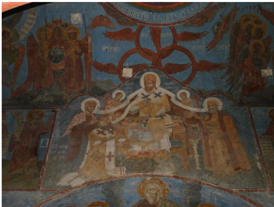
3. The foundation composition

Most of the surviving decorations of the church of the Saviour were made in later times, in 1643-1644, and belong to the tradition of post-Byzantine art. The creators of this mural are considered to be Greek masters, invited by the Metropolitan of Kyiv Petro Mohyla.