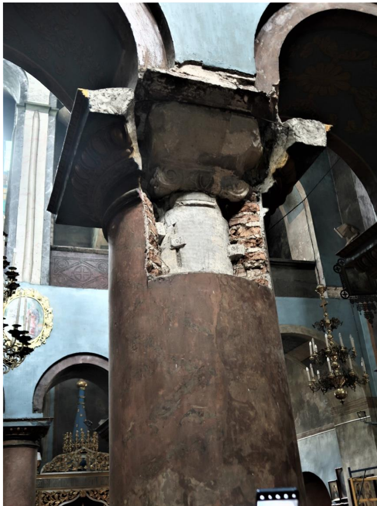
3. Kolumna marmurowa z jońskim kapitelem w soborze Przemienienia Pańskiego w Czernihowie, XI w.

Osobliwością tej świątyni jest obecność we wnętrzu czterech par filarów, w tym pary ustawionej bezpośrednio przy absydach wschodnich oraz zdecydowane odgraniczenie narteksu od wnętrza. Ramiona transeptu od nawy oddzielone były marmurowymi kolumnami z jońskimi kapitelami, które zachowały się we wnętrzu późniejszych, cylindrycznych. Jest to element charakterystyczny dla architektury Konstantynopola.