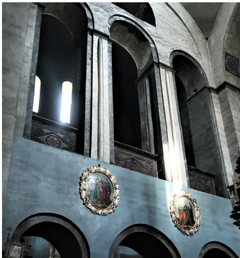
2. Płyty kamienne na emporyze transeptu w soborze Przemienienia Pańskiego w Czernihowie, XI w.

zakończony jest od wschodu trzema absydami, od zachodu narteksem, do którego od północy dostawiono basztę z klatką schodową, od południa baptysterium. Nad nawami bocznymi i narteksem znajdują się empory, zachodnia oddzielona od nawy trzema arkadami. Cerkiew zwieńczona została pięcioma kopułami: z centralną umieszczoną na ośmiobocznym bębnie, bocznymi na czterobocznych, absydy zaś - konchami. Dziś świątynia jest otynkowana i pobielona; pierwotnie dekoracja ścian była surowa, podzielona pilastrami, płaskimi na parterze, profilowanym na piętrze, co odpowiada wewnętrznym podziałom, oraz uskokowymi blendami, wieńczonymi półokrągłym łukiem. Dodatkową dekorację stanowi fryz złożony z krzyży i meandrów, umieszczony nad oknami.