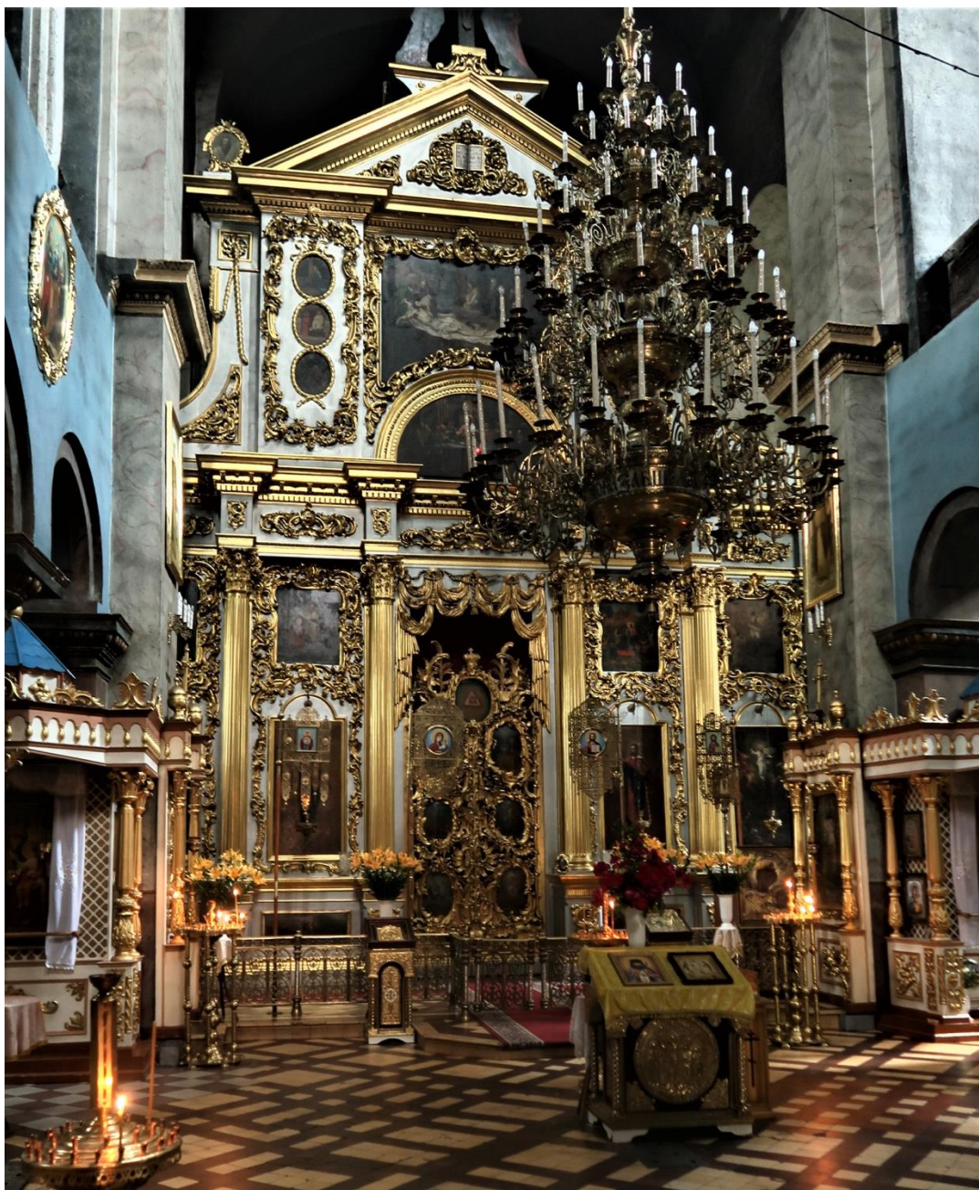
4. Ikonostas w soborze Przemienienia Pańskiego w Czernihowie, 1793-1798