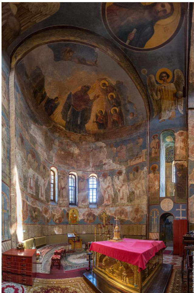
06. Вівтар Кирилівської церкви.

В пам'ятці проводилися значні архітектурно-археологічні дослідження та реставрації настінного живопису. Упродовж багатьох років фахівці ведуть спостереження за температурно-вологісним режимом будівлі, вивчається його вплив на стан живопису, досліджується гідрогеологічний стан Кирилівського пагорбу тощо. У приміщенні церкви підтримуються необхідні мікрокліматичні умови. У 60-ті роки ХХ ст. було знято різночасові нашарування підлоги, аби знизити її до аутентичного рівня ХІІ ст.; під підлогою археологи виявили понад 20 поховань та ретельно дослідили їх. У 1990-х роках дах перекрито мідними пластинами, утеплено горище, у 2006 році навколо пам'ятки влаштовано гідроізоляцію, проведено осушення стін від надлишкової вологи. Зовнішня поверхня стін регулярно тинькується та білиться. Виконано великий обсяг робіт з реставрації інтер'єру: відкриття й консервація фрескового живопису ХІІ ст., закріплення шарів тиньку, фарб, очищення живопису з-під забруднень тощо.