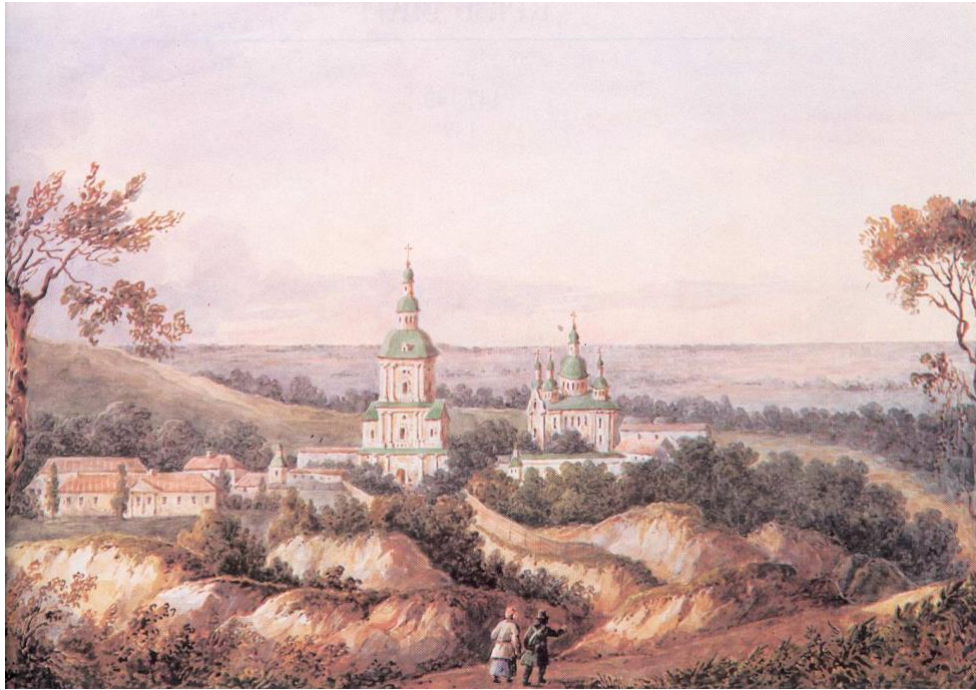
3. Ф. Солнцев. Кирилівський монастир біля села Куренівка, акварель, 1843

Перші післямонгольські звістки про Кирилівський монастир відносяться до 1539 року. Ці документи стосуються його земельних володінь і дають підстави для висновку, що Кирилівський монастир не просто існував, але й функціонував до XVII ст. як упорядкована обитель. На початку XVII ст. патроном Кирилівського монастиря став князь Костянтин-Василь Острозький, який доручив відновлення храму та управління ним і монастирем своєму улюбленцеві — ігумену Василю Красовському-Чорнобривцю, для чого перевів його туди з Острозького монастиря Святого Хреста.