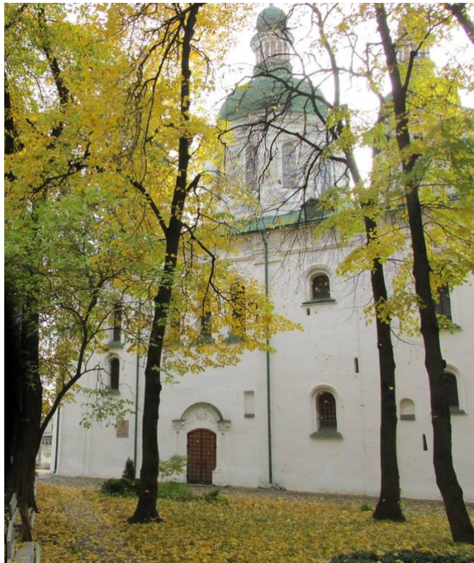
01. Кирилівська церква. Північний фасад. Літописець – автор Є. Марголін.

У 1140 – році Всеволод Ольгович засновує на Дорогожичах Кирилівський храм. Кирилівська обитель є прикладом унікального функціонального поєднання – це сакральний осередок, родовий палацовий храм, фамільна усипальниця та водночас монументальна церква-фортеця. Побудова церкви-фортеці – логічний крок Всеволода, – князя-воїна, князя-стратега, до зміцнення околиць жаданого для багатьох «стольного града».