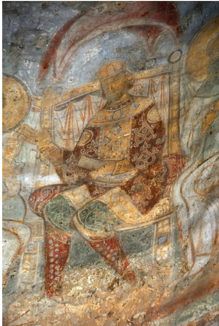
2. Князь Всеволод Ольгович. Персонаж зі сцени «Кирил учить царя». Фреска XII ст. Південна апсида.

Як повідомляють літописи, у тому ж 1179 році померла й була похована в Кирилівській церкві польська княжна Марія Казимирівна — молода дружина онука Марії Мстиславівни та Всеволода Ольговича Всеволода Черного, 1194 року в Кирилівському некрополі з'явилося поховання званої особи: 27 липня в палаці замиської Кирилівської резиденції на 78-му році помер старший син Всеволода Ольговича, великий київський князь, один з головних героїв давньоруської поеми «Слово о полку Ігоревім» — Святослав Всеволодович. Останнє у найдавнішій історії Кирилівського некрополя поховання — сина Святослава Всеволодовича, Всеволода Черного — датується 1215 роком. Згодом під підлогою собору та навколо нього ховали ігуменів, ченців та ктиторів Кирилівської обителі.