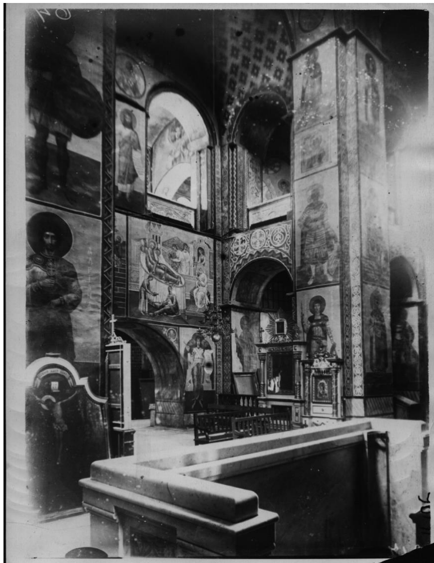
4. Кирилівська церква. Інтер'єр. Фото 30-х р. XX ст.

У 1860 році, під час чергового ремонту, під пізнім тиньком виявлено та частково відкрито унікальні фрескові розписи XII ст. Широкомасштабне відкриття та копіювання давніх фресок здійснили наприкінці XIX ст.