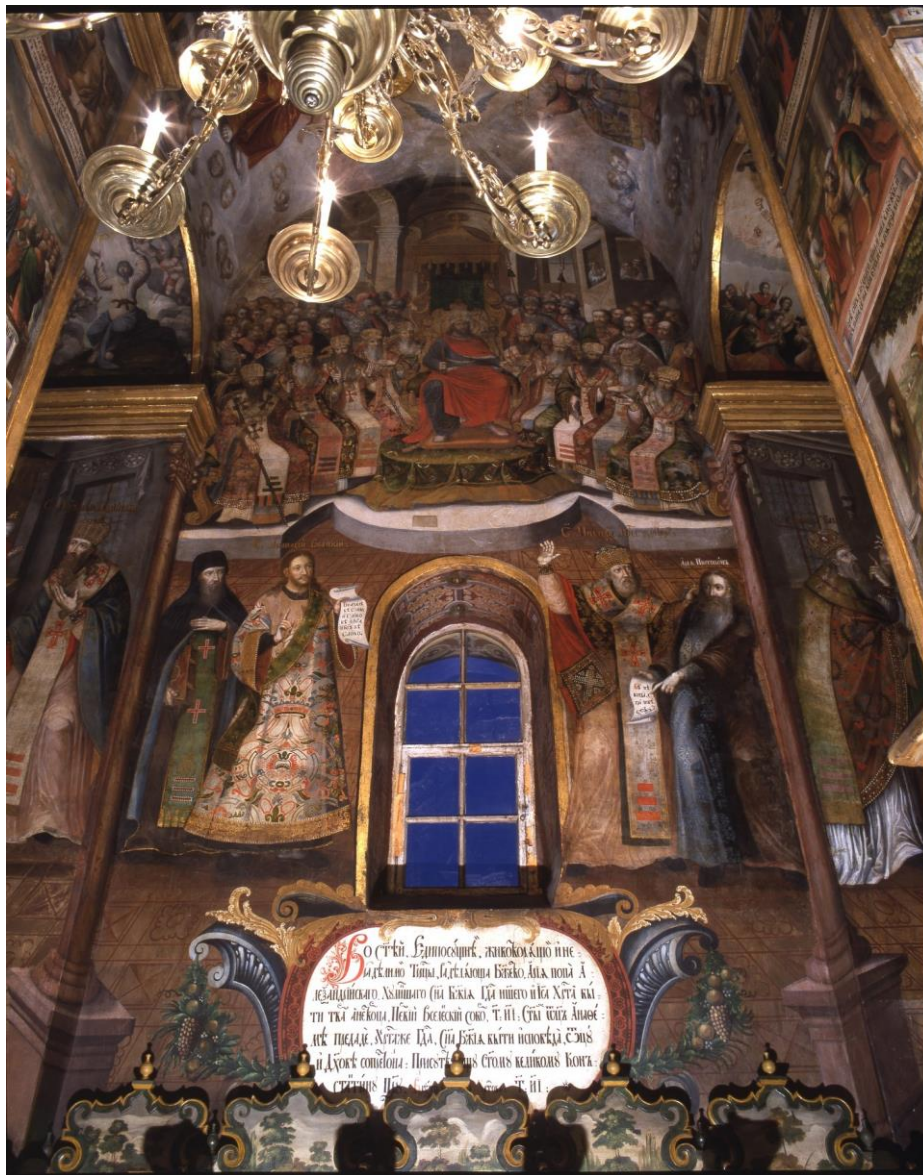
Іл. 8. Перший Вселенський собор. Розписи західної стіни центрального нефа Троїцької надбрамної церкви Києво-Печерської лаври. 20-ті – 30-ті. рр. XVIII ст.

тематичних аналогій з розписами Троїцької надбрамної церкви Києво-Печерської лаври - єдиного повністю збереженого ансамблю розписів лаврської школи доби бароко. Частина композицій відтвореного храму - це, власне, копії, розписів Троїцької церкви.