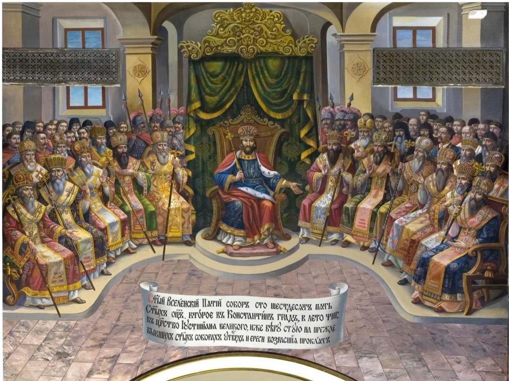
2. П'ятий Вселенський собор. Розписи південної стіни трансепта Успенського собору. 2010-ті рр.

Собор Успіння Пресвятої Богородиці Києво-Печерської лаври - найскладніший і найцікавіший об'єкт реставрації в сучасній Україні. Він був відтворений у формах українського бароко періоду його розквіту. Невелика частина споруди – приділ Св. Іоанна Предтечі відтворено в стилі давньоруського мистецтва. Виконання настінних розписів розпочалося 2007 р. й досі триває, але монументальний ансамбль близький до завершення. В процесі виконання нових розписів Успенського собору було залучено історичні й іконографічні матеріали самого зруйнованого храму, та інших пам'яток з музеїв України, виконаних в стилі українського бароко.