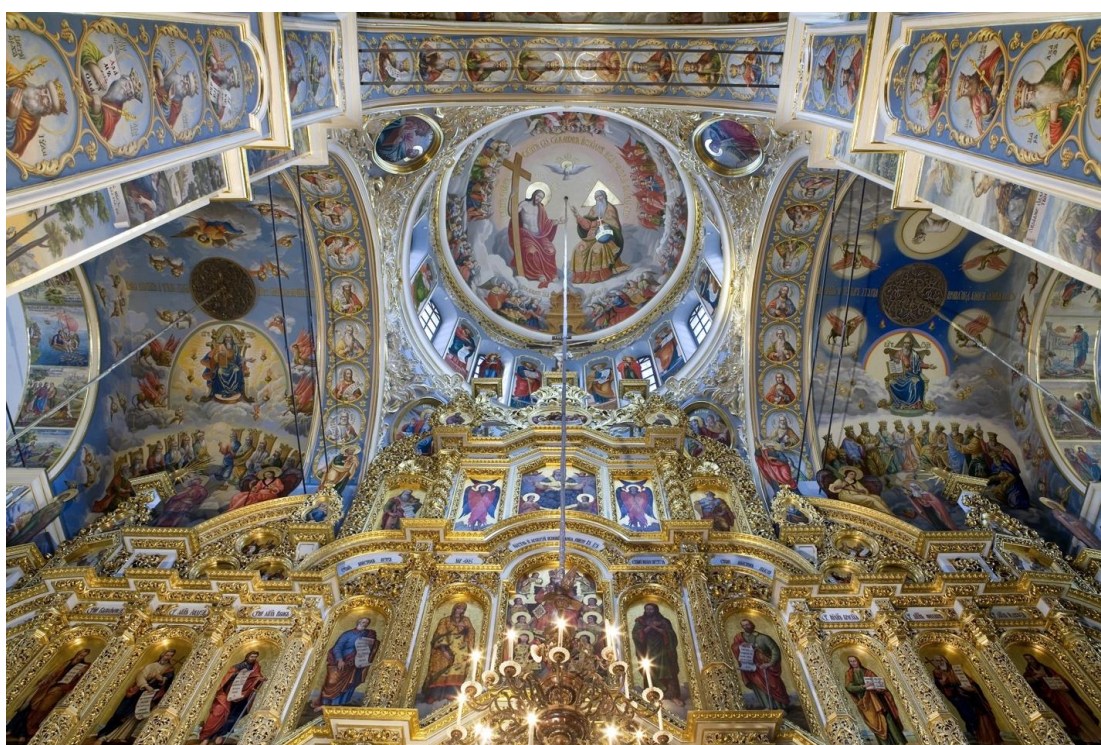
1. Розписи склепінь центральної частини Успенського собору. Загальний вигляд, 2010-ті рр.

Унаслідок пожежі 1718 року внутрішнє оздоблення Успенського собору було майже повністю знищено. Відновлювальні роботи розпочалися 1722 року і тривали 7 років.