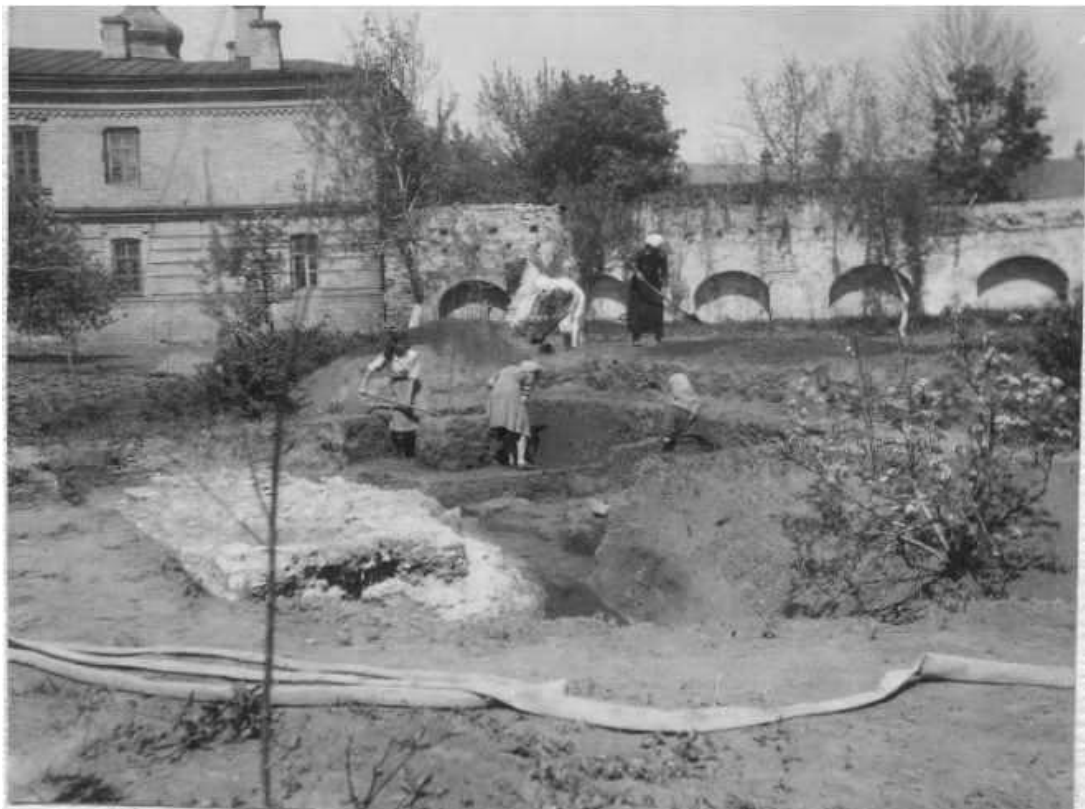
1. Фото з розкопок В. Богусевича 1951 р. у Митрополичому саду

Писемні джерела про муровану стіну Печерського монастиря поодинокі та лаконічні. Уперше кам'яні фортифікаційні монастирські споруди згадуються в «Посланих некоего старца къ богоблаженному Василию архимандриту о скиме». Авторство приписують Кирилові Туровському, а адресата твору зазвичай ототожнюють з настоятелем обителі, архімандритом Васи́лієм, обраним на цю посаду в 1182 р.: «тобою же не точию церковъ бо содела, но и стены каменья около святаы лавры созда». Інформація про існування мурів ґрунтується також на свідченнях у «Синописі» Інокентія Гізеля (1674 р.): «Сам монастир навколо кам'яними стінами був обведений на два стрільбища». Повідомлення важливе як доказ того, що кам'яна стіна дійсно існувала і через кілька століть після її знищення про неї лишилася згадка.