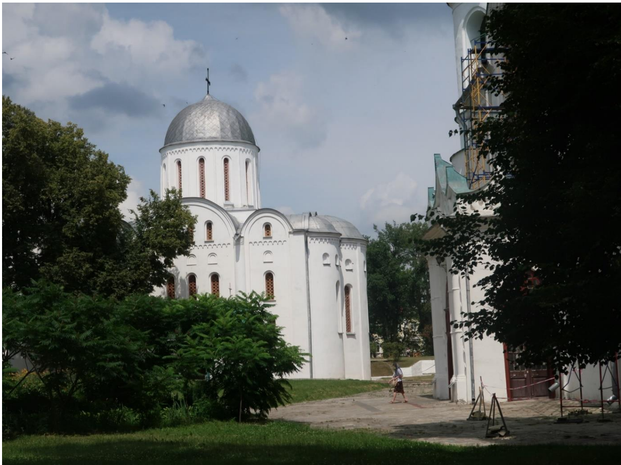
1. Sobór Borysa i Gleba w Czernihowie, XII w., widok od strony południowej

Sobór Borysa i Gleba w Czernihowie został wzniesiony z fundacji księcia Dawida (?–1123), syna Światosława, wnuka Jarosława Mądrego. Był on księciem perejesławskim (1073—1076), muromskim (1076—1093), smoleńskim (1093—1095; 1096—1097), nowogrodzkim (1094—1095) i czernihowskim (1097—1123). Po śmierci został pochowany w wybudowanym przez siebie soborze i zaliczony do grona świętych prawosławnych. Sobór Borysa i Gleba jest wzniesiony na północny zachód od soboru Przemienienia Pańskiego. Pomiędzy oboma budynkami znajdowały się dwa murowane i bogato zdobione książęce pałace z XI i XII wieku.