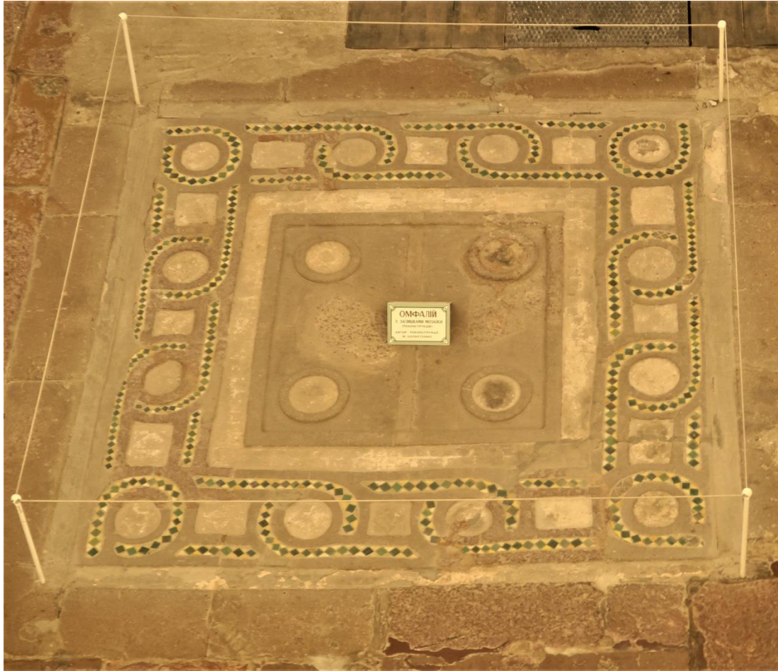
4. Płyta mozaikowa z motywem omfalusa w soborze Borysa i Gleba w Czernihowie, XII w.

Niestety niewiele zachowało się elementów dawnego wystroju wnętrza. W czasie pożaru w 1611 roku został zniszczony cały drewniany sprzęt i części drewnianej konstrukcji, a także malowidła ścienna. Do najcenniejszych zabytków pochodzących z tej świątyni są tzw. Wrota Mazepy, czyli srebrne wrota królewskie ikonostasu ufundowane w 1701 roku przez Iwana Mazepę, a wykonaną przez augsburskiego jubilera, Filipa Jakuba Drentwetta IV. Wykonane w stylu barokowym ukazują wśród wijących się liści akantu, wyłaniające się z kielichów kwiatowych wizerunki czterech ewangelistów, świętych Borysa i Gleba, oraz spoczywających w dole Jessego i króla Dawida.