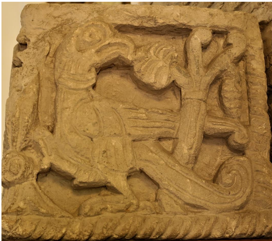
2. Relief zoomorficzny w soborze Borysa i Gleba w Czernihowie, XII w.

Sobór jest budowlą krzyżowo-kopułową, trójnawową, sześćofilarową z trzema absydami od wschodu i kopułą na wysokim bębnie na skrzyżowaniu nawy głównej i transeptu. Nad narteksem i nawami bocznymi znajdują się emporry, na które wiodą wąskie schody w zewnętrznej ścianie zachodniej. Jest to typ budowli zapoczątkowany przez kijowskie monasterskie świątynie: Zaśnięcia Bogurodzicy w Ławrze Pieczarskiej i Św. Michała Archaniola o Złoty Kopułach i był on często naśladowany przez budowniczych ruskich w wiekach XII i XIII. Od strony zachodniej, północnej i południowej główny korpus otaczało jednokondygnacyjne obejście. Ściany wzniesione są z cegieł wykonanych z białego kaolinu, ułożonych w równe rzędy. Jest to technika budowlana nowa, zastępująca bizantyńską ( opus mixtum z warstwą cofniętą), typową dla wieku XI.