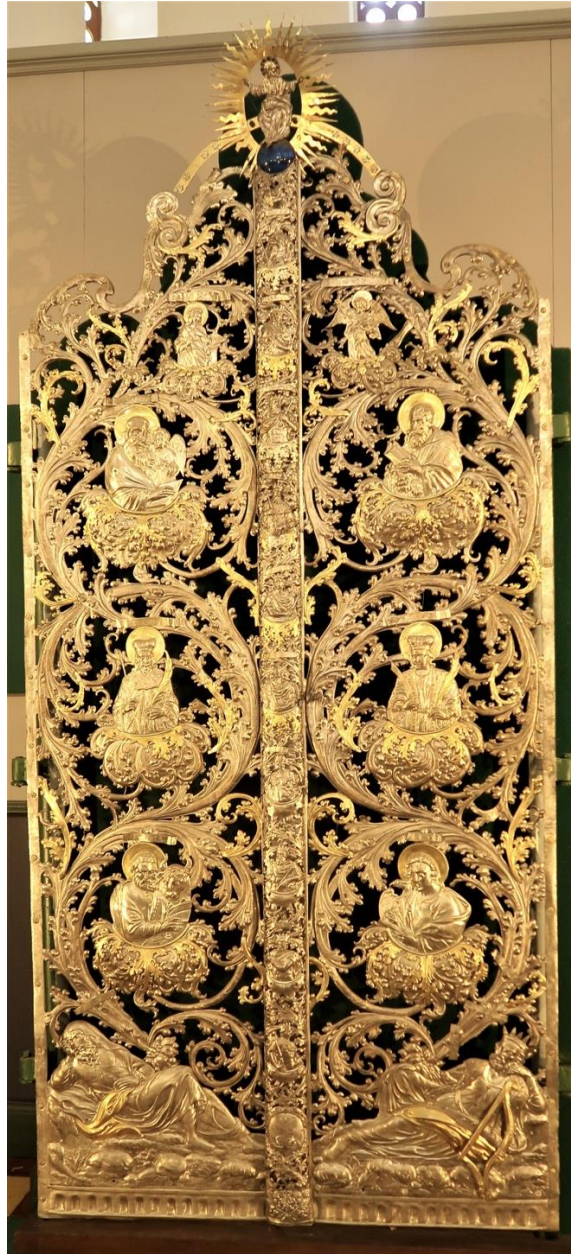
5. Philipp Jacob Drentwett IV, wrota królewskie w soborze Borysa i Gleba w Czernihowie, 1701 r.

Ponadto, w górnej partii kompozycji znajdują się małe figurki Bogurodzicy i Archanioła Gabriela, tworzących tradycyjny w programach ikonostasu temat Zwiastowania , a na słupku w dole wrót herb Mazepy, następnie popiersia dziesięciu królów żydowskich, przedstawiających rodowód Chrystusa, a na samej górze Zbawiciel w glorii. Wysoki poziom artystyczny dzieła każe zaliczyć je do arcydzieł sztuki jubilerskiej. Są one eksponowane we wnętrzu świątyni. Sobór jest częścią rezerwatu architektoniczno-historycznego, prowadzone są starania o wpisanie go na Listę światowego dziedzictwa UNESCO.