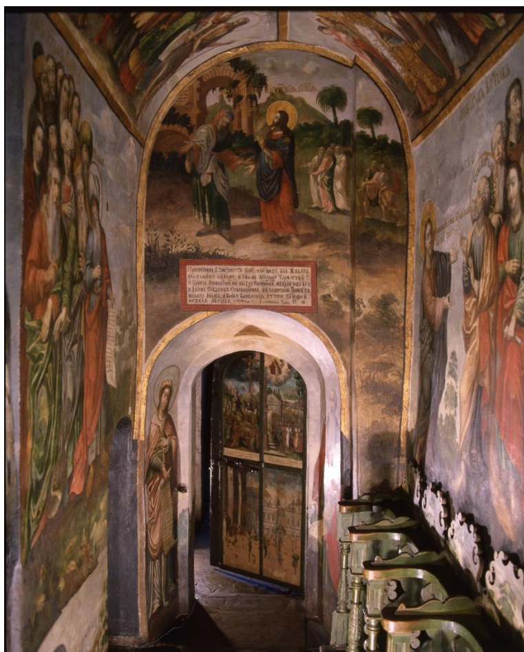
3. Розписи другого поверху притвору Троїцької церкви. 20-30-ті рр. XVIII ст.

Будівля храму – двоярусна, мурована у техніці кладки Opus mixtum з плінфи та валунів на цем'янковому розчині. На верхньому ярусі розташована церква – чотиристовпна, хрестовокупольна, одноглава, без виявлених об'ємів апсид на східному фасаді. В храмі збереглися розписи двох історичних періодів XII (?) і 20-30-х рр. XVIII ст. Давньоруський фресковий живопис, що пізніше був заштукатурений і записаний, зберігся фрагментарно. Його виявлено на початку 1990-х рр. під час реставрації та консервації живопису XVIII ст. Сюжети наразі визначити немає змоги.