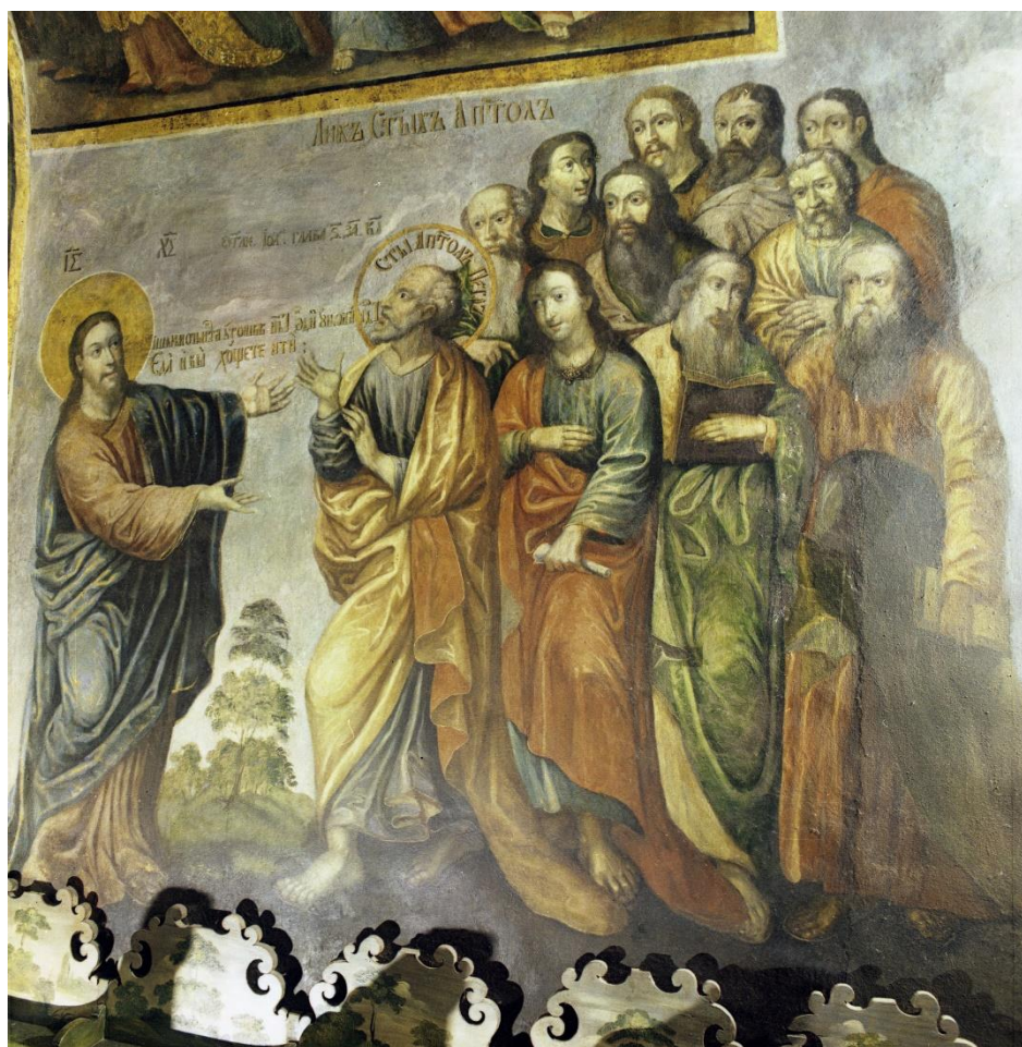
5. Христос із апостолами. Росписи другого поверху притвору, 20-30-ті рр. XVIII ст.

У типажах облич персонажів розписів Троїцької церкви, їхніх позах і жестах, вбранні, манері побудови композиції, колористичній гамі відображено особливості творчої манери майстрів лаврської живописної майстерні першої половини XVIII ст.