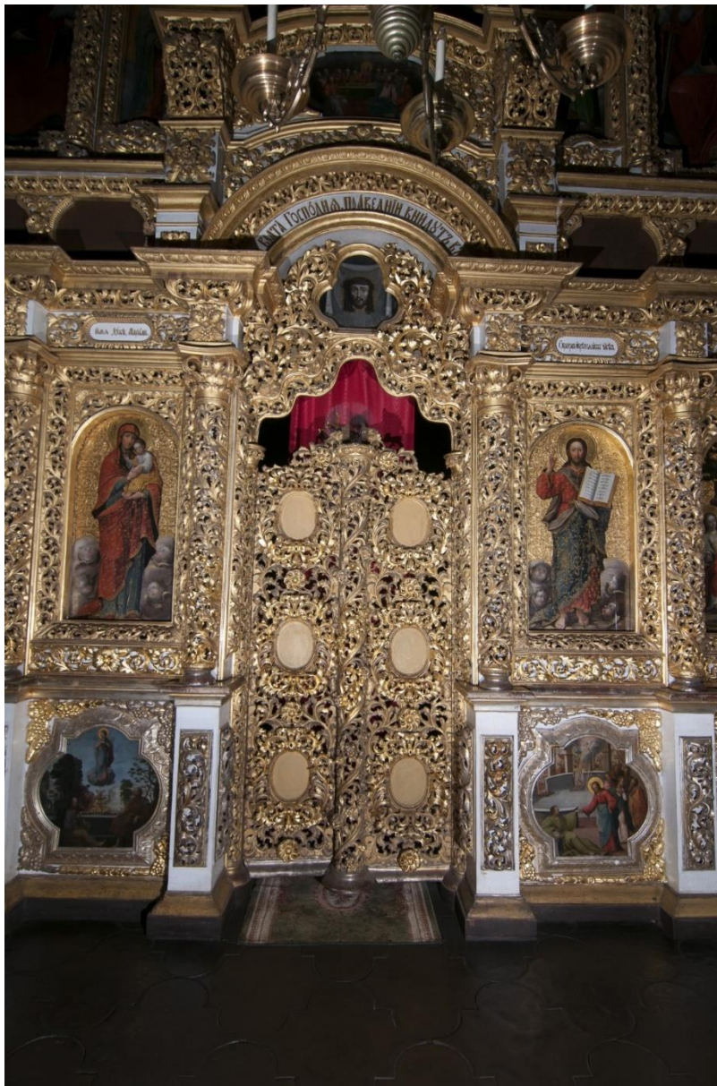
6. Иконостас троїцької церкви, 1734- 1735 рр. деталь.

Печерському») і ліворуч («Богоматір Живоносне Джерело», «Втеча Лота із Содому», «Божественна провість прп. Феодосію Печерському») від Царських врат. Тематика зображень типова для барокової естетики й поетики. Десять ікон празникового ряду, а також шість ікон з Царських врат втрачено.