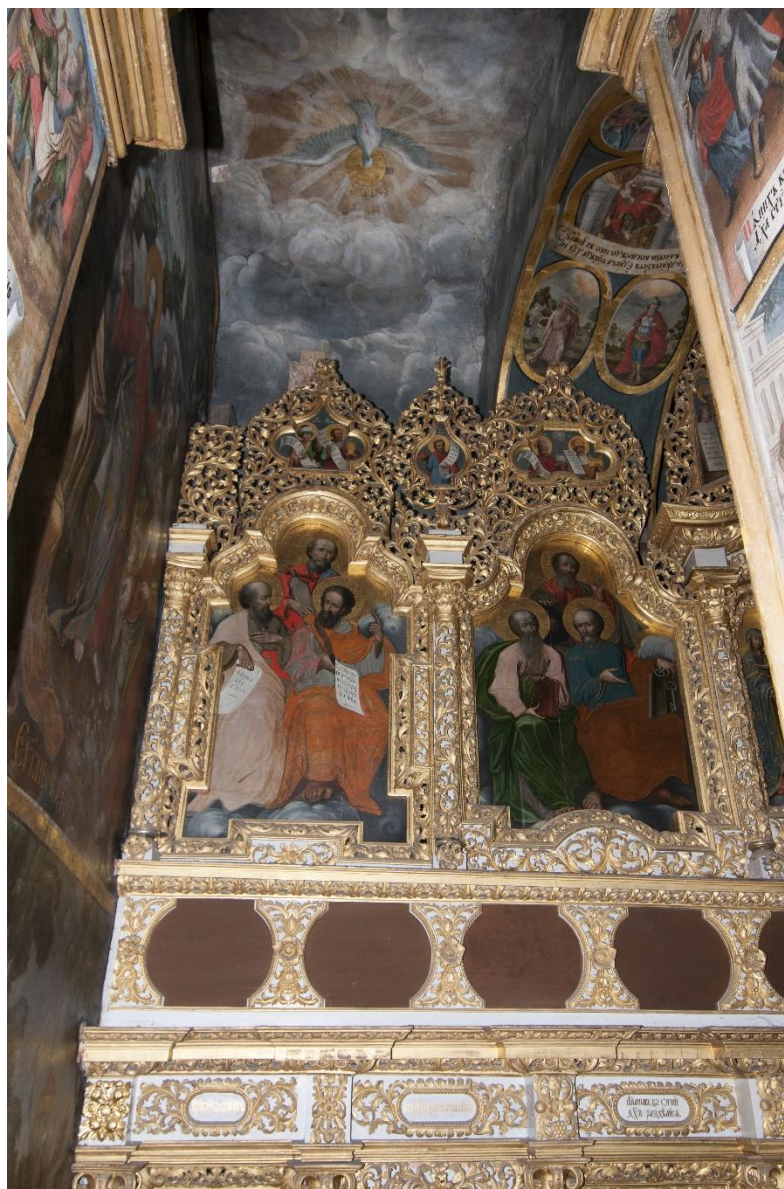
7. Іконостас троїцької церкви. Апостольський і пророчий ряді, 1734- 1735 рр.

Карниз у верхній частині іконостаса має складну конфігурацію. Ікони верхнього ряду - одинадцять образів пророків і праотців розміщено на різному рівні. Під центральною іконою «Господь Св. Дух» - різьблене зображення мушлі, обабіч – образи прабатьків Адама і Єви.