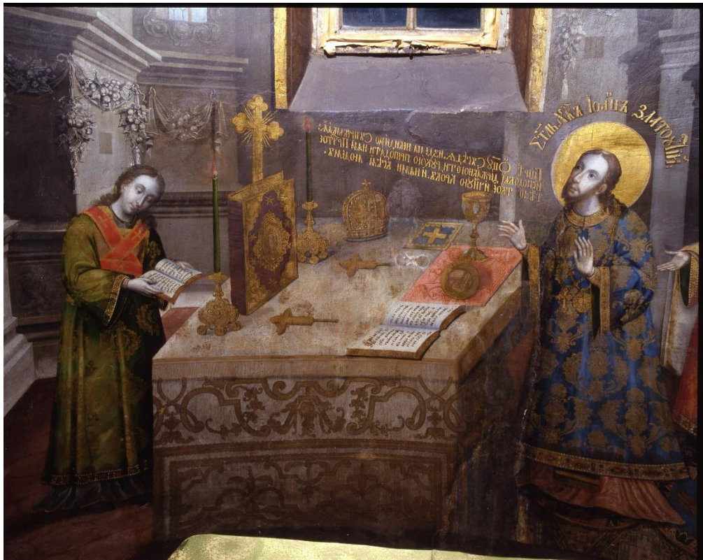
4. Літургічна сцена. Центральна апсида, 20-30-ті рр. XVIII ст.

Богословську програму розпочато у стінопису притвору (сіней). Усі розписи сіней є єдиною складною композицією: у головному склепінні представлено Бога Отця в оточенні Небесних Сил («Соберет избранія своя от четырех вітров»); на стінах на тлі краєвиду зображено процесію з кількох багатофігурних груп – святих преподобних, дівичів, мучеників, царів, святителів, пророків, апостолів і праотців; на чолі двох груп над входом – Богоматір та Св. Іоанн Предтеча. Всі зображені в притворі праведники разом представляють Небесну торжествуючу Церкву.