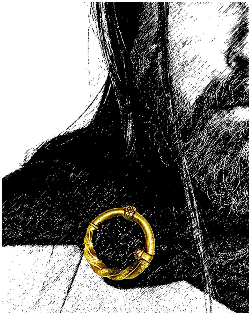
Рис. 3. Місце фібули у середньовічному костюмі (реконструкція Д. Пефтіця)

цьому одягу прийшов інший, який щільніше прилягав до тіла і застібався за допомогою гудзиків або зашнуровувався. Це і замінило кільцеві застібки.