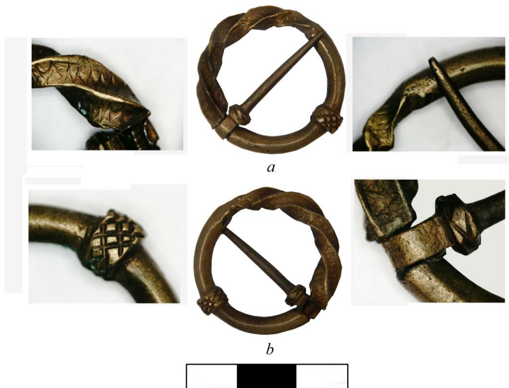
Рис. 2. Фібула з експозиції музею історії Києво-Печерської лаври

Виявлена фібула кругла, діаметром 27 мм. Одна її половина виготовлена з круглого, а інша – з перекрученого дроту. В одному з двох стиків розташоване заглиблення для кільця голки. Голка, завдовжки 27 мм, у верхній частині має кільцеподібне потовщення завширшки 5 мм та завтовшки 4 мм. Ще одне потовщення – значно ширше і орнаментоване мотивом у вигляді косих ліній, що пересікаються, – міститься посередині гладкої та круглої у перетині частини виробу (рис. 2).