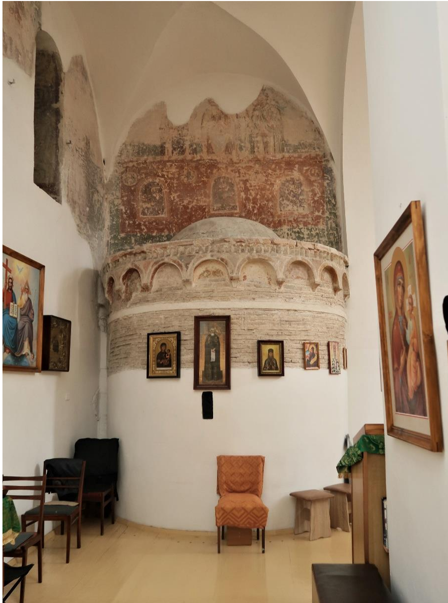
4. Absyda chrzcielnicy w soborze Zaśnięcia Najświętszej Bogurodzicy w Czernihowie

Polichromie pokrywały zapewne wszystkie ściany cerkwi, a zgodnie z XVII-wieczną relacją Joanicjusza Galatowskiego, opisującego cuda ikony Matki Boskiej Jeleckiej, Oranta, na wzór kijowskich wizerunków, znajdowała się w konsze głównej absydy. Dziś zachowało się inne przedstawienie Matki Boskiej Orantki, na ścianie absydy w chrzcielnicy. W czasie prac restauracyjnych z lat 90. XIX wieku i II. 30. XX wieku odkryto zachowane do dziś fragmenty