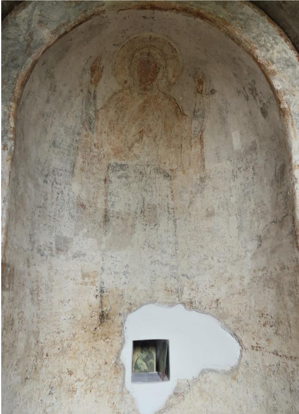
3. Matka Boska Orantka, fresk, absyda chrzcielnicy w soborze Zaśnięcia Najświętszej Bogurodzicy w Czernihowie

architektoniczny typowy dla sztuki romańskiej. Ściany zewnętrzne są rozczłonkowane, przeprute licznymi uskokowymi oknami, podzielone wysokimi półkolumnami i pilastrami, ozdobione fryzem arkadowym. We wnętrzu zachowały się fragmenty XII-wiecznych malowideł.