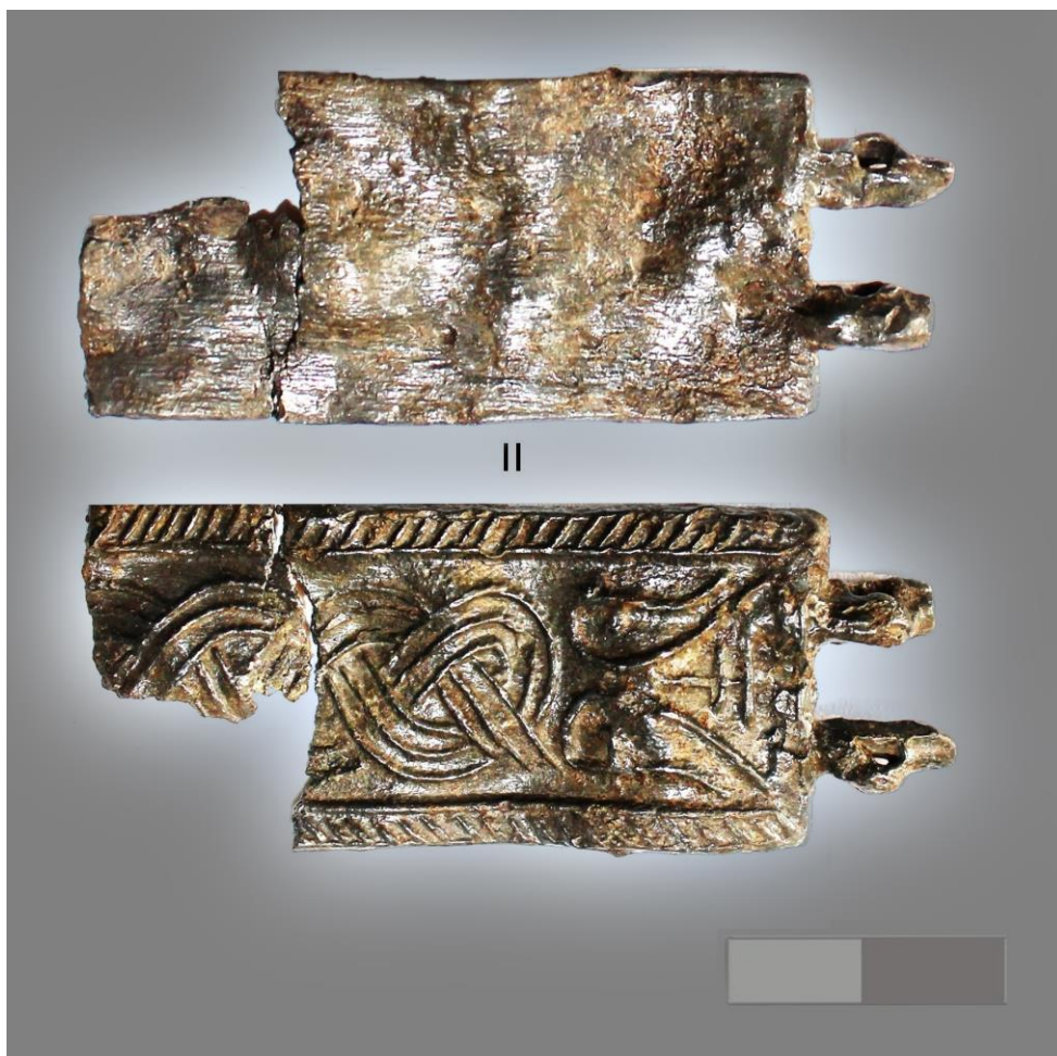
Рис. 6. Фрагменти стулкового браслета XII–XIV ст. з Митрополичого саду Києво-Печерської лаври

геометричним або рослинним орнаментами – переплетеними опуклими лініями стилізованого рослинного візерунку або вервицями, що імітували зернь та філігрань. Жодний такий знайдений браслет не має слідів чорніння. Позаяк технологія нанесення чорніння на прикрасу була складною та трудомісткою, яка потребувала від майстра досвіду, вміння, певних економічних витрат, вона не відповідала потребам масового ринкового виробництва. Використання черні на прикрасах для широкого кола споживачів було нерентабельним, на відміну від срібних наручів, що виготовляли на замовлення шляхом відтискання за матрицею, і які завжди були індивідуальними виробами.