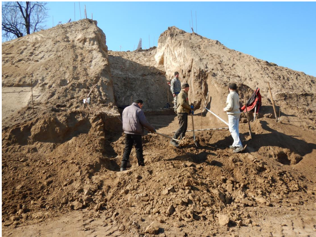
Рис. 4. Археологічний нагляд за земляними роботами на валу Київської фортеці під час науково-рятивних досліджень на території церкви Спаса на Берестові у 2018–2019 рр.

Атрибуція та хронологічна належність виробу ускладнена його фрагментарністю, адже нам не відомі ані спосіб кріплення підвіски до основної частини сережки, ані кількість підвісок у прикрасі. Тим важливіше придивитися до деталей, а саме зауважити мініатюрні розетки на стержні, які розділяють намистини. За матеріалами Новгород, Пскова і Твері такі розподільні розетки відомі у XIV–XVI ст. Центральна ажурна намистина нашої підвіски виконана у звивисто-спіральному стилі скані, який переважав в оформленні сережок XVI ст. Подібні традиції оздоблення продовжувалися і в наступних, XVII–XVIII століттях. Дві прикраси з найбільш близькими до нашої елементами зберігаються у музеях Москви. Перша – це срібна із золоченням «двійчатка» початку XVIII ст. з Державного історичного музею, в якій на трохи вигнутих стержнях підвісок по 3 схожі на наші намистини, але без розподільних розеток (рис. 5: а ). Друга – пара золотих «трійчаток» початку XVIII ст. з музею Московського Кремля, де менші за довжиною бокові підвіски мають такі розетки між ажурною та суцільною намистинами (рис. 5: б ).