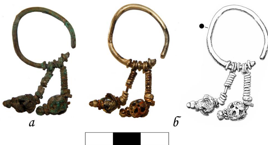
Рис. 1. Сережка XIV–XV ст. з території церкви Спаса на Берестові до (а) і після (б) реставрації. Художниця-реставраторка Н. Онопрієнко, рисунок Д. Пєфтіця

Жіночі прикраси під час археологічних досліджень на території Національного заповідника «Києво-Печерська лавра» трапляються рідко, це й зрозуміло з огляду на те, що монастир завжди був чоловічим. Хіба, може, збереглися в похованні заможної пані чи яка прочанка загубила б. Власне, таке сталося при дослідженні Успенського собору ще у 1986 р., коли у виявленому в цегляному склепі жіночому похованні XVII ст. була позолочена сережка з камінцем. Наступна подібна знахідка була зроблена більше, ніж через 30 років під час досліджень 2018–2019 рр. на території церкви Спаса на Берестові. Це сережка, виготовлена з білого металу (вірогідно, срібла), у вигляді округлої розімкнутої дужки діаметром 2,3 см з двома перевитими дротом стержнями-підвісками довжиною 1,5 см (рис. 1). Стержні завершуються ажурними намистинами, закріпленими невеличкими суцільними намистинками.