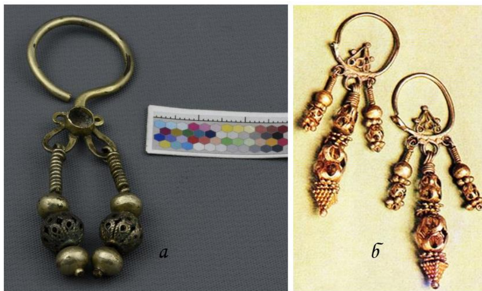
Рис. 5. (а) Сережка-«двійчатка» поч. XVIII ст. з Державного історичного музею (Москва) та (б) сережки-«трійчатки» поч. XVIII ст. з музею Московського Кремля

Враховуючи місце знахідки нашої прикраси під північним валом, який споруджували як частину Печерської фортеці на початку XVIII ст., хронологія підвіски, вірогідно, охоплює XVI–XVII ст., можливо, другу частину цього періоду.