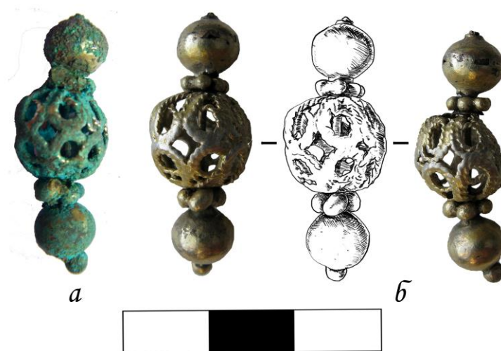
Рис. 3. Підвіска сережки з території церкви Спаса на Берестові до (а) і після (б) реставрації. Художниця-реставраторка Н. Онопрієнко, рисунок Д. Пефтіця

За формою і конструктивними особливостями наша сережка вписується у хронологічний відрізок – друга половина XIII ст. – XV ст., а тип кріплення її підвіски – на спрощеному шарнірі – з'являється ближче до закінчення цього періоду. Срібна сережка, «на кільці якої вміщені дві ажурні, видовженої форми, підвіски», наведена у каталозі 1902 р. Богдана та Варвари Ханенків, була знайдена в Києві на розі Володимирської та Великої Житомирської вулиць і зарахована авторами до «предметів Великокнязівської епохи», тобто давньоруського часу. Більш вірогідно, що вона пізнішого походження. Враховуючи особливості кріплення підвісок, прикраса може бути датована часом не раніше XIV–XV ст. На білоруських теренах дві подібні прикраси («завушніцы») у вигляді кільця з трьома підвісками ажурно-філігранних та простих намистин на обвитих дротом стержнях знайдені у похованні XIII–XIV ст. з Колозької церкви у Гродно. Але найближча аналогія до нашого зразка – срібна позолочена сережка з двома підвісками із філігранними намистинами – походить із Вільнюського замку, де датована XIV ст. (рис. 2).