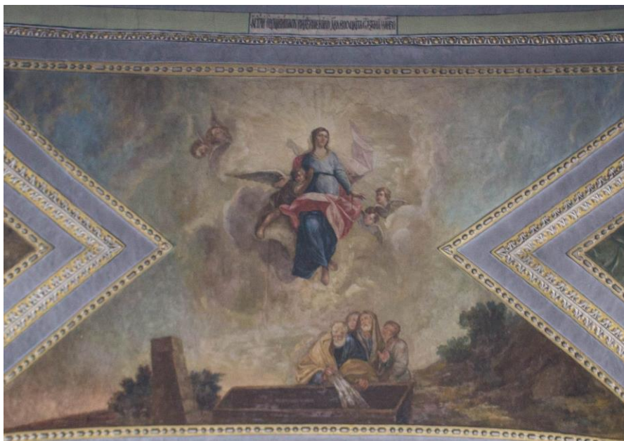
11. Взяття Божої Матері на небо. Стінопис XIX ст. Сучасний вигляд.

Стінопис на склепінні Троїцького собору дуже тонко продуманий, відтворений і одночасно є оригінальний. Стеля центральної частини собору розписана за мотивами двох молитов. Склепіння вівтаря містять композиції, що ілюструють молитву «Отче наш», а склепіння центральної нави зображають у сюжетах молитву «Символ віри». У центральному куполі традиційно зображена храмова композиція «Новозавітна Трійця», у трансептах у північній наві – цикл подій із життя та ушавлення Божої Матері, у південній – цикл із земного життя та страждань і ушавлення Ісуса Христа. (Іл. 11)