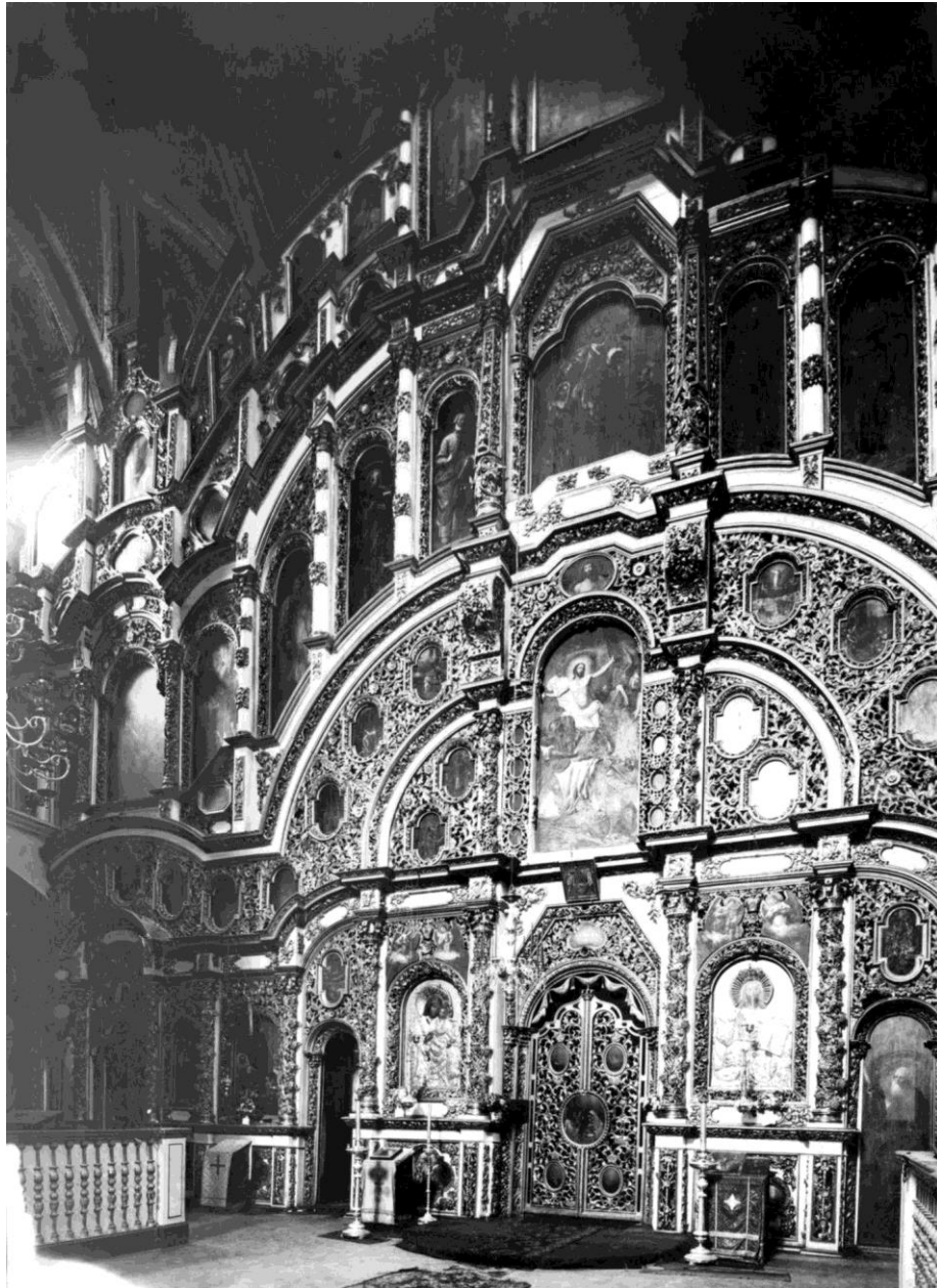
6. Іконостас 1920 р. (?). з експедиції Харківського музею українського мистецтва. 1920-і рр. (?) Опубліковано 17.07.2021 р. facebook.com.

Архітектурна пластика західного, південного та північного фасадів Троїцького собору виконана у єдиному стилі. Східний фасад має ідентичний фронтон та три апсиди. Центральна апсида п'ятигранна з пілястрами на кутах, досягає до фронтона. Цим східний фасад відрізняється від інших. Відтак можна відзначити всефасадність споруди Троїцького собору, що відрізняє його від пам'яток західноєвропейської архітектури. Святковий урочистий вигляд собору підкреслюють бані, виконані у барочних формах.