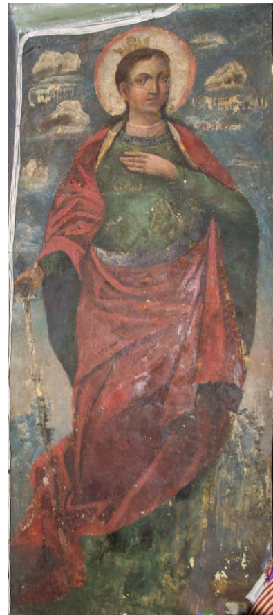
8. Іоанн Предтеча. Сучасний вигляд у стінописі Троїцького собору.