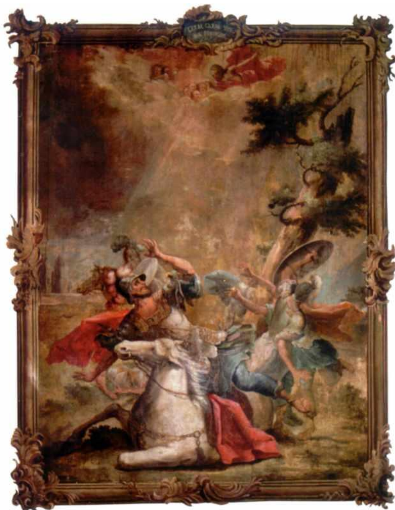
10. Увірування Савла. Стінопис Троїцького собору друга половина XVIII ст.

Так, на північній стіні храму збереглися дві великі композиції «Увірування Савла» та «Архангел Михаїл», які датуються к. XVIII ст., а композиція на цій же стіні, ближче до вівтаря, «Катування святих Михайла і Федора», на думку реставраторів, була поновлена на початку XIX ст. На протилежній південній стіні паралельно до сюжетів на північній стіні розміщені композиції «Печерська Богоматір з предстоящими Феодосієм і Антонієм Печерськими», яка грубо переписана у XX ст. і місцями спотворена авторським тоном, а наступні дві композиції – «Житіє Св. Іллі», «Видіння старців», датуються початком XIX ст. (Іл. 10)