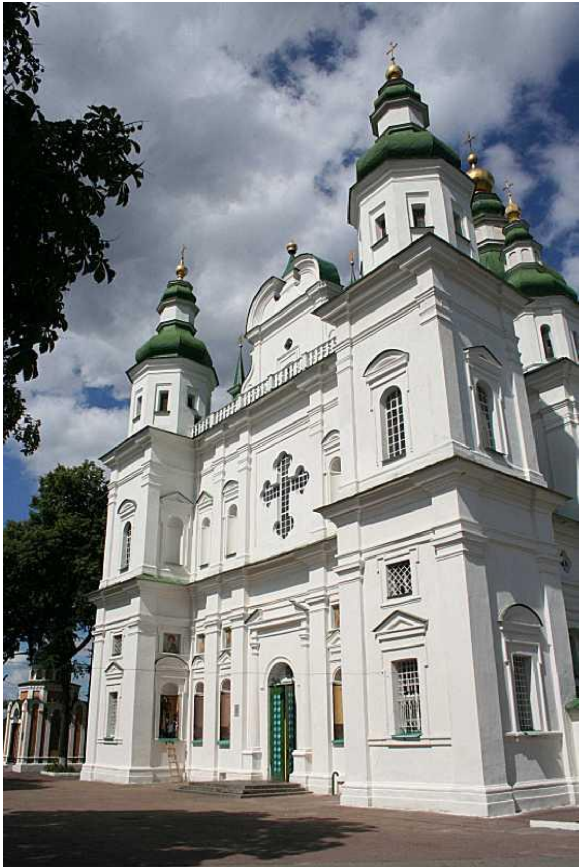
4. Троїцький собор. Південно-західний фасад. 3 серпня 2005 р.