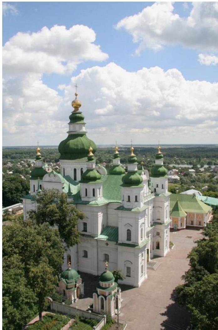
12. Троїцький собор. Північний фасад. 2011 р.

Відомо, що під підлогою собору розміщена система підземних камер, які займали увесь простір під центральною навою, віттарем і трансептом – семикамерний склеп з двома входами: з південного боку собору вхід зроблено в одноповерховій прибудові – тамбурі, і з північного нефу – із середини собору. Тут була усипальниця представників місцевої церковної верхівки і багатих родин Чернігова з XVIII–XX ст. Представники роду Кочубеїв, Милорадовичів, Скоропадських.