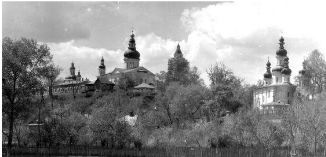
2. . Панорама Троїцько-Іллінського монастиря. Фото Г. Логвина 1960-х рр.

наполягав, щоб центром православ'я став Чернігів. Майбутню резиденцію митрополита Л. Баранович вирішив розмістити в Іллінському монастирі, тому й почав розбудову нової садиби, яка мала стати духовним і культурним центром Лівобережної України, а величний архітектурний ансамбль увиразнив би нове призначення.(Іл. 3)