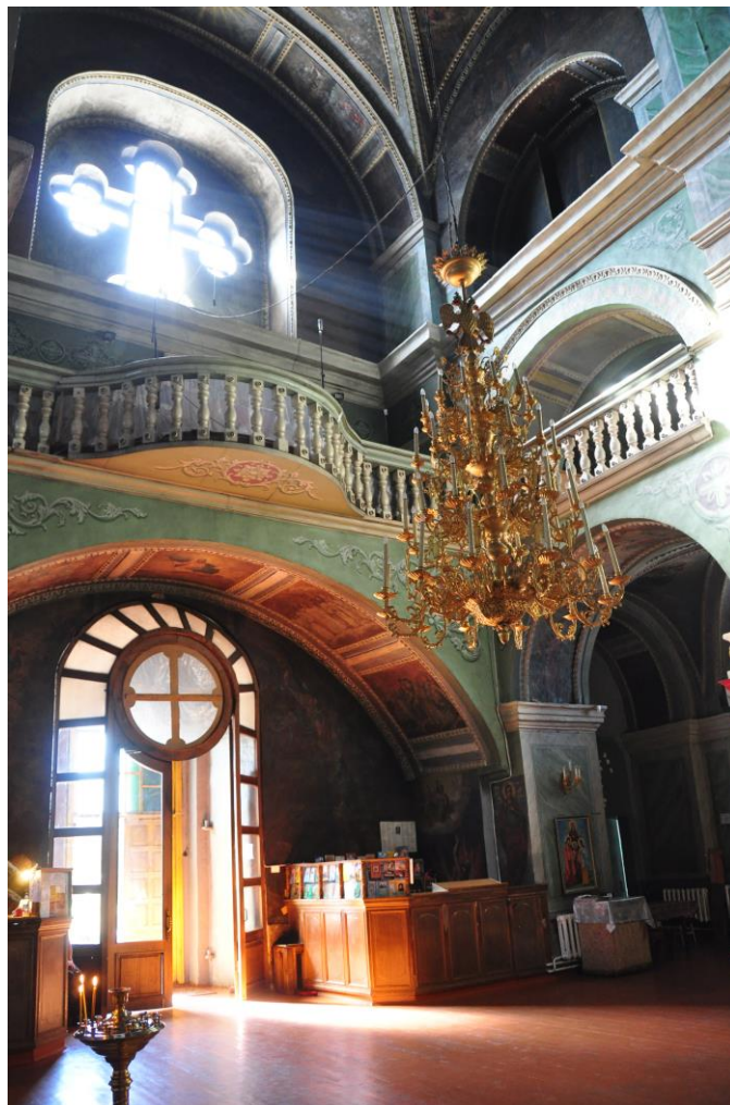
5. Троїцький собор всередині. Вхід.

Троїцький собор зовні потиньковано та побілено, що підкреслює пластичність декору, виконаного із застосуванням різної форми вікон, ніш, пілястр, карнизів, сандриків. Так, декілька характерних прикмет в екстер'єрі – це активність силуету, у якому сім бань композиційно підтримані барочними фронтонами, а між пілястрами на фасадах обох ярусів у товщі стін розміщені півциркульні ніші. У таких нішах у католицьких храмах ставили скульптури, натомість у Троїцькому соборі в нішах першого ярусу знаходяться зображення православних святих. На фасадах другого ярусу над входом до собору із північного, південного та західного боку розміщені великі вікна у вигляді хреста.