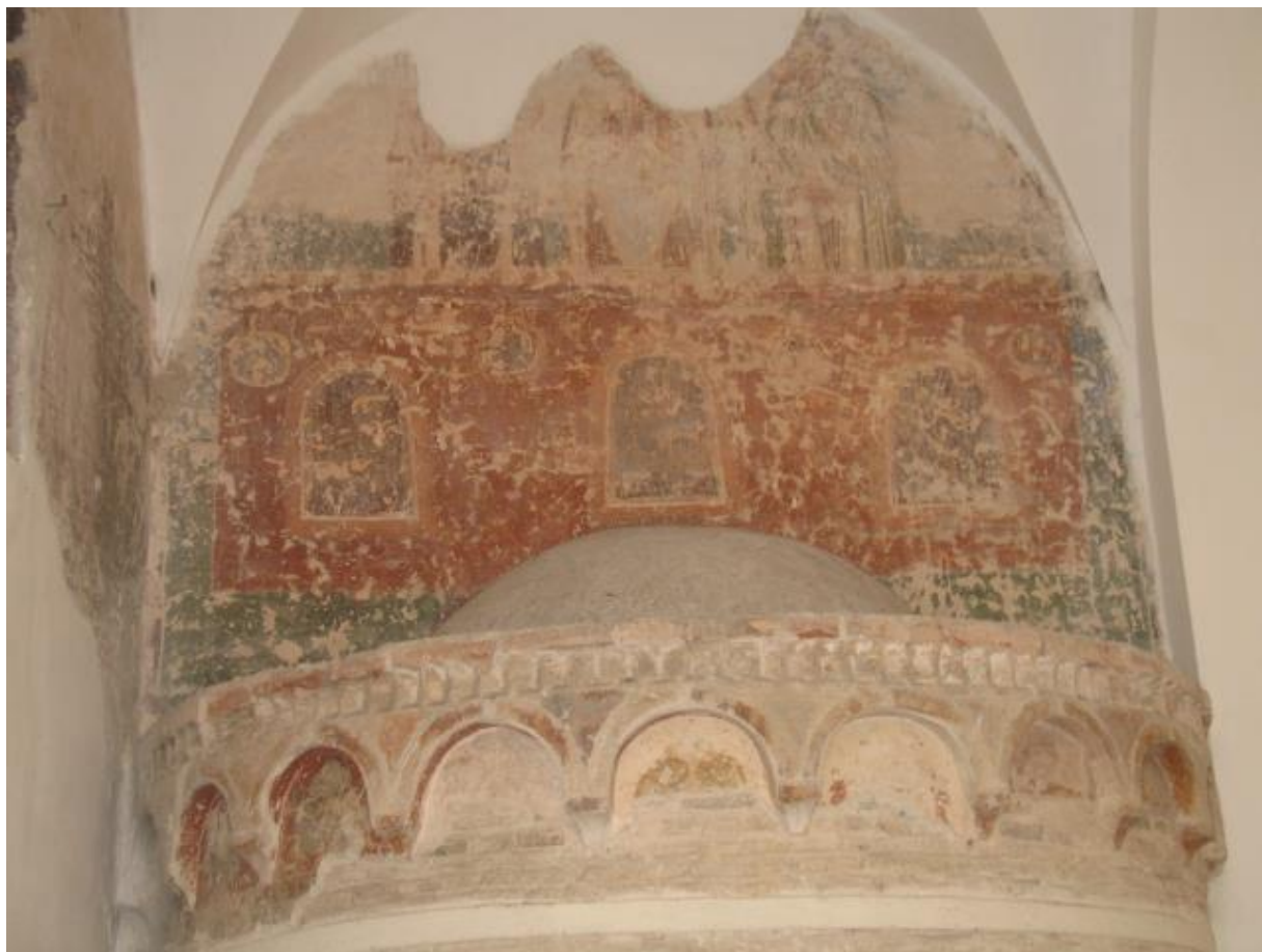
2. «Три юнаки у вогняній печі». Фресковий розпис. Над абсидою хрещальні у південній наві Успенського собору Єлецького монастиря.

червоного відтінків. Відомо, що зображення Богородиці Оранти у конхах абсид було поширеним явищем у візантійському мистецтві, а звідси і в давньоруських храмах Києва, Новгород, Чернігова. У нартексі на піденній та частково західній стінах збереглися ще деякі фрагменти фрескового розпису із залишками фігур святих, ангелів тощо, які ідентифікувати через незадовільний стан досить складно.