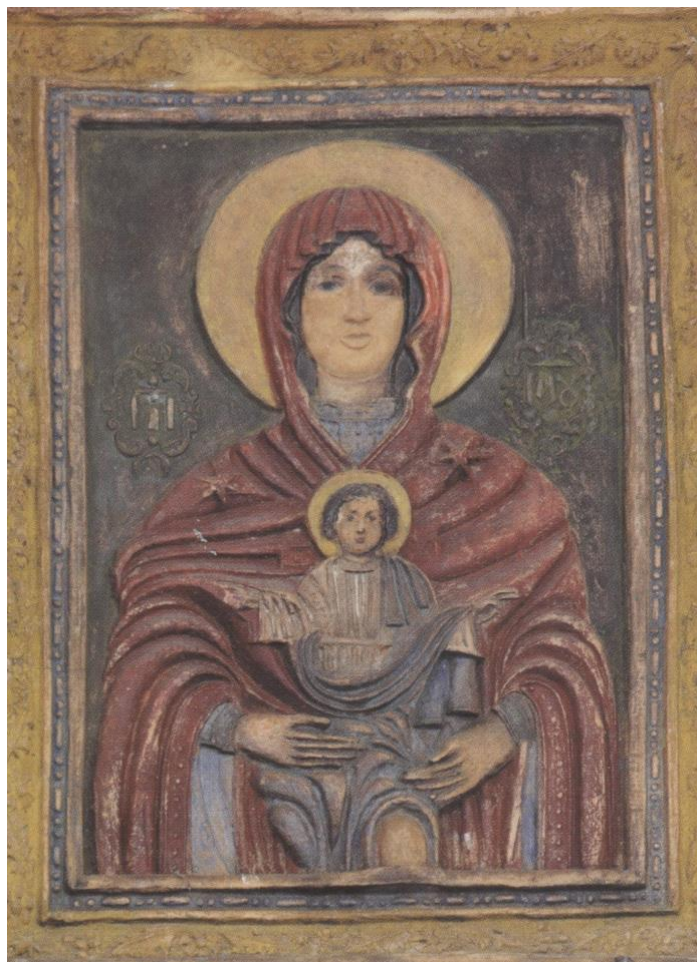
3. Ікона «Єлецька Богородиця». Дерево, темпера, олія, позолота. 90-ті роки XVII ст.

національної дерев'яної, а також форми й прийоми західноєвропейської архітектури. Цей тип тринавого, багатокупольного храму був втілений у багатьох соборах Києва, Чернігова, Батурина, Глухова, Полтавщини. Відомий козацький літописець Самійло Величко посав про Лазаря Барановича що він був: “дбалий майстер та невсипущий будівничий для реставрації зруйнованих церков та монастирів за свій кошт”.