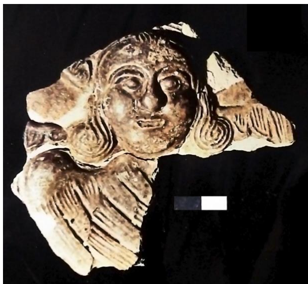
Рис. 1. Фрагмент кахлі з розкопок 1991 р. Ill. 1. Fragment of tile (excavations of 1991)

Український письменник і поет XVII ст. ієромонах Климентій у своєму творі «О гончарях: слово віршоване похвальне» так визначав творчу працю кахельників: «Гончарі також й кахляні печі виставують/ і різні на кахлях оздоби мудрують/.../Аж би ... хотів на тую дивитися/ піч: і грітись, до такої мило притулитись». І якщо наприкінці XV – на початку XVI ст. кахельні грубки були атрибутом лишень замків та палаців, то вже з кінця XVI ст., а повсюдно – з XVII ст. вони стають надбанням не тільки міського, а й сільського населення. У кийівському реєстрі 1762 р. зазначений 81 гончар. Серед них чимало кахельників, які працювали також і для монастирських потреб. Відомо, наприклад, що майстер Кожем'яченко на замовлення Києво-Печерської лаври виконав ліпні та розписні кахлі для грубок у казначейській та економічних келіях.