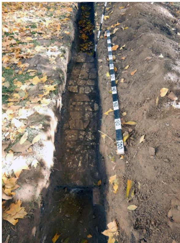
Рис. 6. Розкопки С. Тараненка поблизу корпусу № 3 у 2019 р.