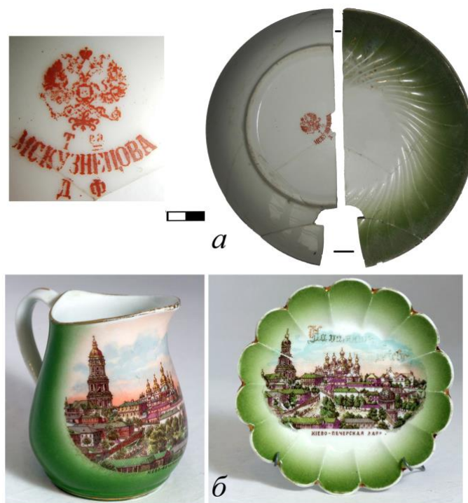
Рис. 2. а – фрагмент блюдця з клеймом Дмитрівської фабрики Товариства М. С. Кузнецова; б – молочник та тарілка «На память из Киева. Киево-Печерская лавра». Фабрика «Товариства М. С. Кузнецова» (поч. XX ст. – 1918 р.) (Корусь 2015)

У 1887 р. Ризька фабрика увійшла у створене 1887–1889 рр. «Товариство виробництва порцелянових і фаянсових виробів М. С. Кузнецова» з правлінням у Москві. У 1900-х рр. воно включало 8 власних фабрик, крім того налічувалося 10 «постійних торгівель», зокрема й у Києві.