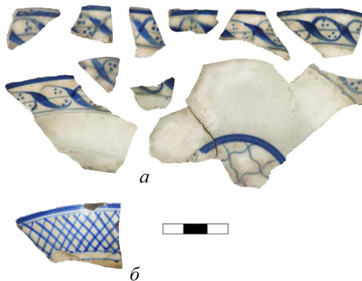
Рис. 4. Фрагменти тарілок із синім кобальтовим розписом виробництва Гжельського гончарного осередку

з музикантами на чашці з експозиції палацу Венеції у Римі (виріб мануфактури Цзиньдечжень 1700–1725 рр.) (рис. 3: в).