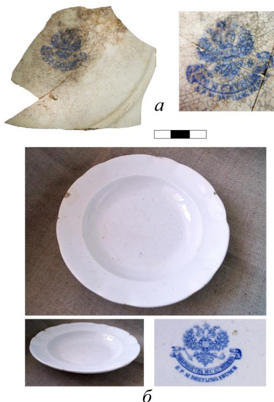
Рис. 1. а – фрагмент тарілки з клеймом фабрики Товариства М. С. Кузнецова у Дрейлінгсбуші, м. Рига; б – порцелянова тарілка з клеймом фабрики Товариства М. С. Кузнецова у Дрейлінгсбуші, 1890–1910 рр. ( http://museum-lesnoy.ru/korol-russkogo-farfora/ )

Археологічні дослідження шарів XVIII–XIX століть серед іншого періодично супроводжуються знахідками фрагментів фаянсового та порцелянового посуду. Вони, як правило, не привертають особливої уваги, звичайна справа – розбили тарілку або чашку на митрополичій кухні чи під час монастирської трапези та й викинули друзки. Але яку цікаву інформацію вони можуть надати! Ось, наприклад, фрагменти ніби непоказної білої тарілки, знайдені у 2019 р. в одному з шурфів біля корпусу № 3. На денці проглядається нечітке синє підполив'яне клеймо (рис. 1: a ). На ньому зображений Малий державний герб Російської імперії з написами «Т-ва М. С. КУЗНЕЦОВА» (у картуші) та нижче під ним «К. Р. М. DREYLINGSBUSCH». А так виглядає подібна нашій ціла тарілка з таким же клеймом (рис. 1: b ).