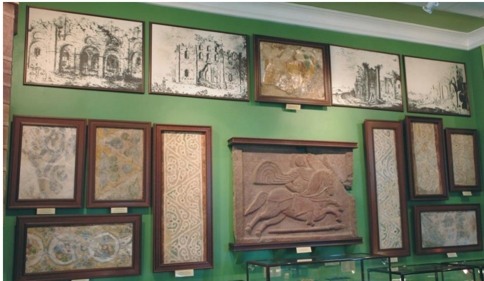
9. Музей історії Михайлівського Золотоверхого монастиря, експозиція з шиферним рельєфом (знахідка 1998 р.) і повернутими Державним Ермітажем фресками.