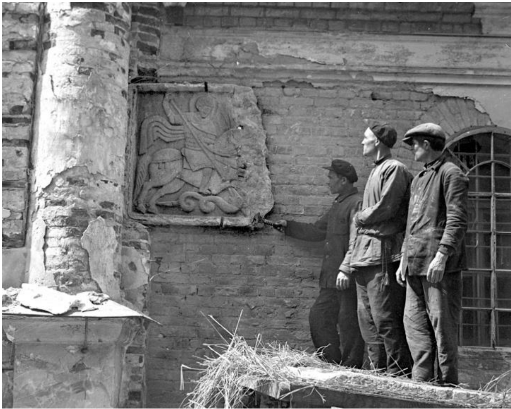
4. Демонтаж шиферних рельєфів зі стіни паперті собору. 1933 р.

У 1918 р. в Україні остаточно стверджується влада більшовиків. Одним з найагресивніших елементів більшовицької ідеології був атеїзм. Тому відразу після їх приходу розпочинається ліквідація релігійних організацій усіх віросповідань і конфесій. Точна дата закриття Михайлівський Золотоверхого монастиря не відома, але службу у його соборі проводили ще досить довго. Закрили Михайлівський собор на початку 1930 р., після чого влада запланувала переобладнати його під студентський гуртожиток. Київська інспектура охорони пам'яток культури та природи, звернулася з цього приводу до Всеукраїнської Академії наук і спільними зусиллями їм вдалося пам'ятку на певний час уберегти. Але шиферні рельєфи у 1933 р. зі стіни собору про всяк випадок зняли (іл. 4) і для кращої збереженості перевезли до «Музейного городка». Це був заповідник з комплексом музеїв (офіційна назва Всеукраїнський «Музейний городок»), який науковій громадськості Києва вдалося створити на території закритого у 1926 р. Києво-Печерського монастиря (лаври). Основною функцією усіх музеїв була пропаганда атеїзму, тим не менш, їм дозволялося збирати і експонувати предмети мистецтва, вилучені при ліквідації релігійних громад, що на той час було великим досягненням. На початку 1930-х рр. Київська інспектура охорони пам'яток планувала створити ще один заповідник «Київський Акрополь», ядром якого мали