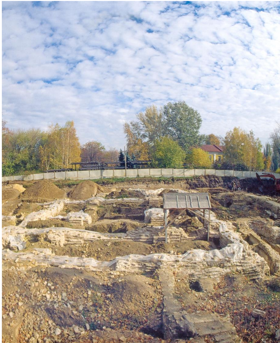
б. Розкопки підмурків собору (Г. Івакін). 1997 р.

на Михайлівській площі, а на площі Ленінського комсомолу (нині це Український дім на Європейській площі). Місце собору збереглося вільним і цього разу.