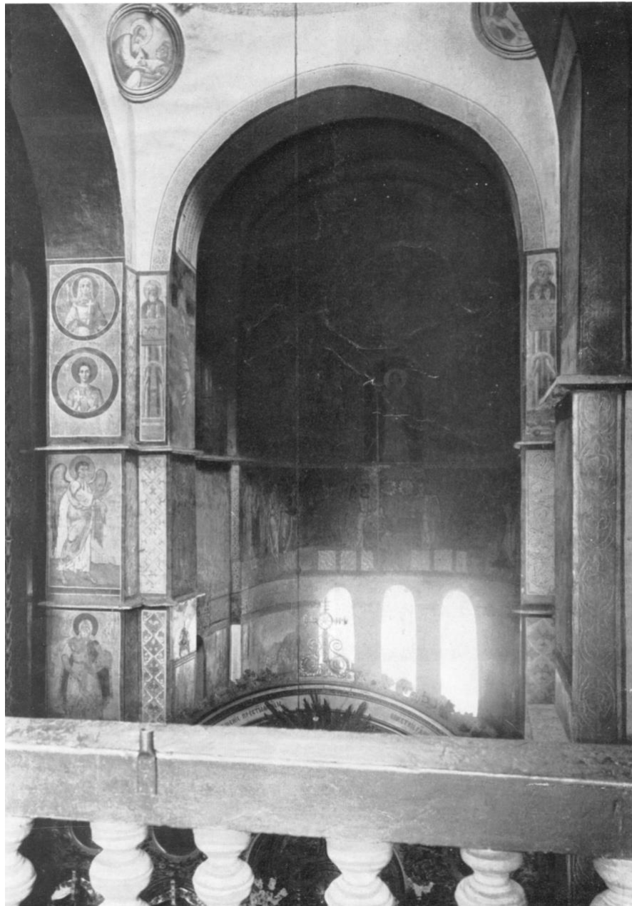
3. Вівтарна арка собору. На стовпах арки записані фрески, в апсиді рештки мозаїк.

Національному Києво-Печерському заповіднику) [3, с. 120, 121, 174, 175]. У цей період на території монастиря було знайдено шиферний рельєф з двома кінними святими воїнами (іл. 12), який належва одному із зруйнованих храмів. Це був уже другий виявлений у монастирі рельєф. Перший рельєф також з двома святими воїнами-вершниками знайшли у XVIII ст. і вставили у монастирський мур. В 1888 р. обидва рельєфи розташували на зовнішній стіні південної паперті Михайлівського собору поряд, створивши умовну реконструкцію історичного ансамблю [3, с. 112 -119, 172-174].