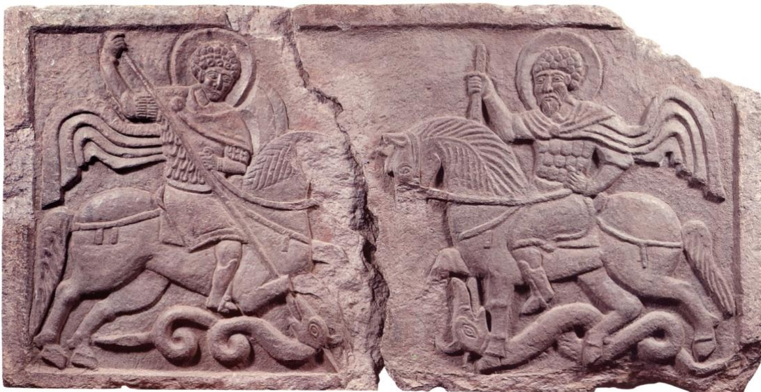
12. Шиферний рельєф зі святими воїнами-вершниками. Національний заповідник «Софія Київська».