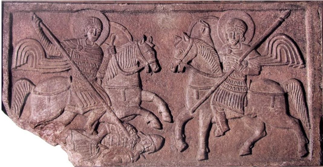
11. Шиферний рельєф зі святими воїнами-вершниками. Державна Третяковська галерея, Москва.

передала Ермітажу фреску святителя Миколая і мозаїчний орнамент. У 1974 р. обидві ці пам'ятки повернули до Третяковської галереї, а фрески, отримані з Новгородського заповідника, залишалися в Ермітажі ще півстоліття.