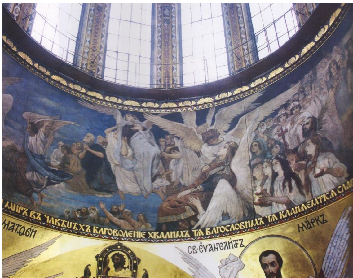
7. Розпис Васнецова

Під головним куполом широким колом іде барабан, на якому й поставлений купол. По всьому його колу Васнецов зробив розпис (1889 р.), який є просто унікальним за своїм сюжетом і не має аналогів (№7-8). Перед нами — дивовижна замкнута в коло (символ Вічності) картина, яка зображає невинне устремління людей у Рай. В літературі сюжет дістав назву «Переддвер'я Раю» (варіанти: «Радість праведних» або ж «Райські двері»), а вже в наш час цей твір атестують як початки модернізму й символізму в російському живописі.