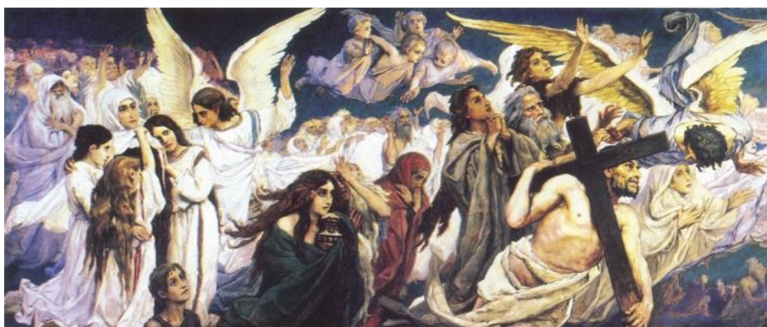
8. Розпис Васнецова

Технологія роботи була така: художник спочатку малював фарбами на полотні повномасштабну картину, яку його помічники калькували на стіну, далі майстер коригував живопис, а деякі фрагменти переписував. У центрі сюжету — три архангели, Михаїл, Гавриїл