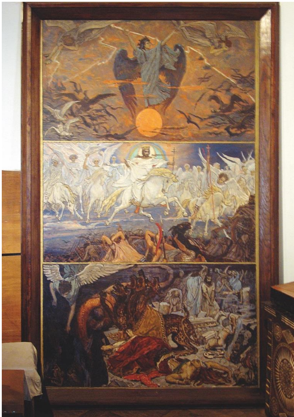
10. «Вавилонську блудницю»

Перше від вітваря - «Розпяття» подано цілком неочікувано: немає Голгофи, трьох хрестів, воїнів, Богородиці тощо, навіть повного хреста з фігурою Спасителя. Є лише вершина хреста на тлі розірваних хмар, ледь помітного рожевого Місяця і тьмяного багряного Сонця. Космічні вихори лілового та помаранчевого кольору оперізують хрест із Тілом Христовим. Ангели, притискаючись до Тіла Христового, трепетно огортають його своїми крилами і торкаються головами у невтішній печалі. А зверху хрест тримають, ніби у нестримному бажанні піднести його до небес, два ангели у напруженому трагічному польоті. На блідому чолі Христа яскраво проступають крапельки крові від тернового вінця. У Васнецова Христос пасіонарний — Він виражає не стільки індивідуальні емоційні переживання євангельської оповіді, скільки універсальне богослов'є Тіла.